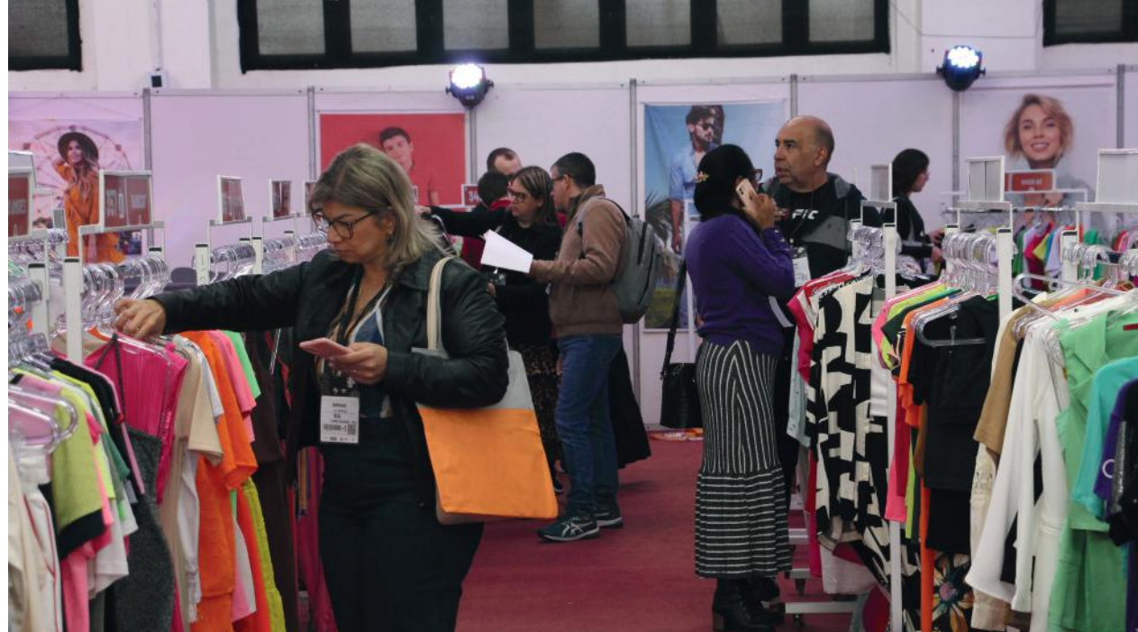
O evento reuniu no Pavilhão da Fenarrec mais de 750 lojistas ao longo de quatro dias de realização, que adquiriram produtos da coleção Alto Verão 2024, de 150 fabricantes catarinenses

Esta edição da Pronegocio contou com algumas novidades, entre elas o aplicativo para os compradores, uma ferramenta tecnológica que visa otimizar o tempo e proporcionar uma experiência ainda melhor