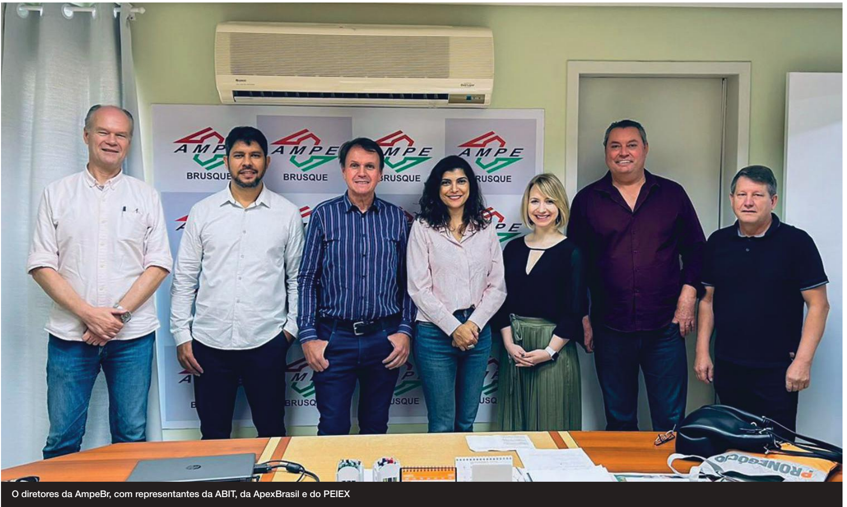
O diretores da AmpeBr, com representantes da ABIT, da ApexBrasil e do PEIEX