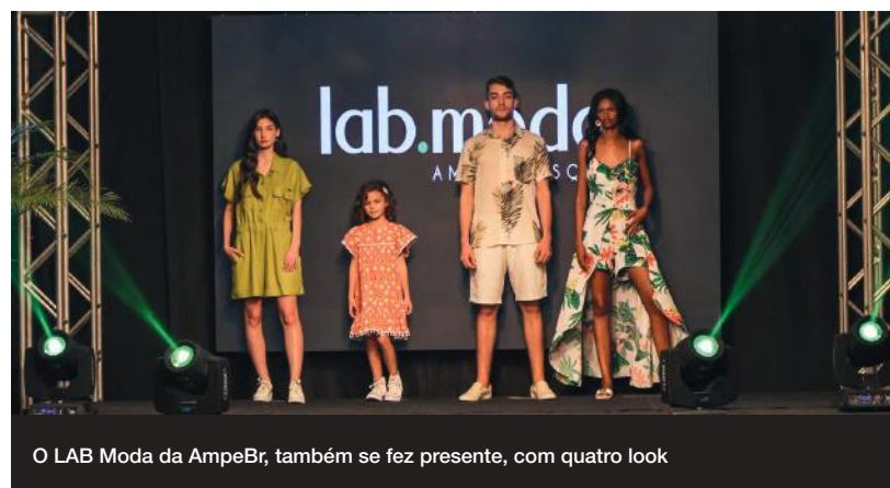
O LAB Moda da AmpeBr, também se fez presente, com quatro look