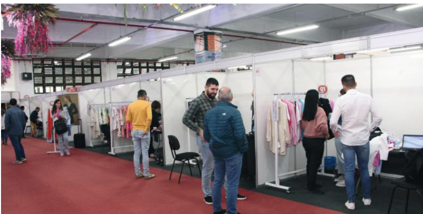
A 63ª Pronegócio novamente ultrapassou as expectativas e metas esperadas da AmpeBr, ao longo dos quatro dias de realização do evento

Com o encerramento da 63ª Pronegócio, a AmpeBr inicia os preparativos para a Preview de Inverno 2024, que acontece em novembro no Hotel Monthez e será exclusiva para 20 lojistas e 70 fabricantes. Além disso, nos dias 15 a 18 de janeiro a entidade realiza a 65ª Pronegócio, que apresenta a coleção de Inverno 2024, no Pavilhão da Fenareco. Mais informações: (47) 3351-3811.